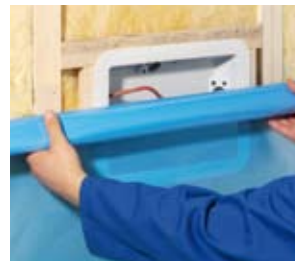
Mit innenliegendem Wechsel. Montage avant pare-vapeur.