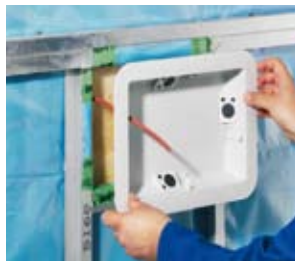
Mit aufliegendem Wechsel. Montage après pare-vapeur