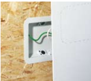
Installation mit OSB-Platte. Montage avec plaque OSB.

En cas de montage avant le pare-vapeur, l'étanchéité de la feuille doit être rétablie par un ruban autocollant. En cas de montage après le pare-vapeur, celui est recouvert par les larges bordures du boîtier lors de sa fixation, ainsi l'étanchéité est garantie. Le boîtier EnoX est idéal pour l'intégration de luminaires, haut-parleurs, displays et d'autres appareils électroniques.