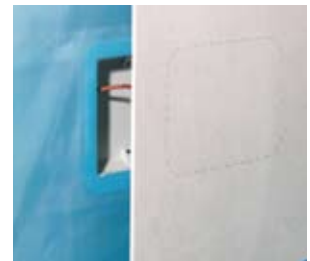
Mit innenliegendem Wechsel. Montage avant pare-vapeur.